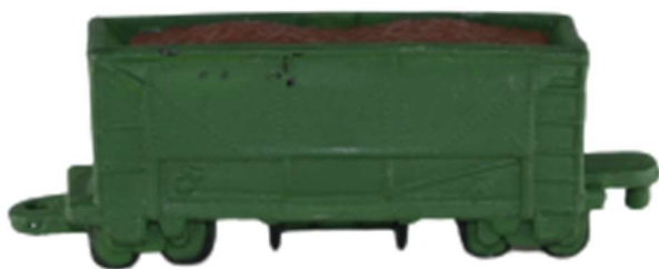
nákladný vagón na rudu