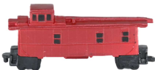
služobné vozidlo vlaku