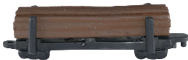
vagón na drevom